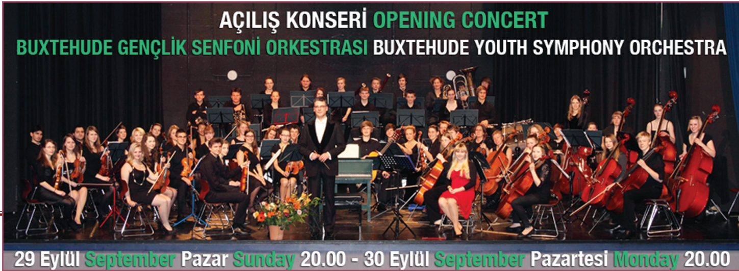
AÇILIŞ KONSERİ OPENING CONCERT BUXTEHUDE GENÇLİK SENFONİ ORKESTRASI BUXTEHUDE YOUTH SYMPHONY ORCHESTRA

29 Eylül September Pazar Sunday 20.00 - 30 Eylül September Pazartesi Monday 20.00